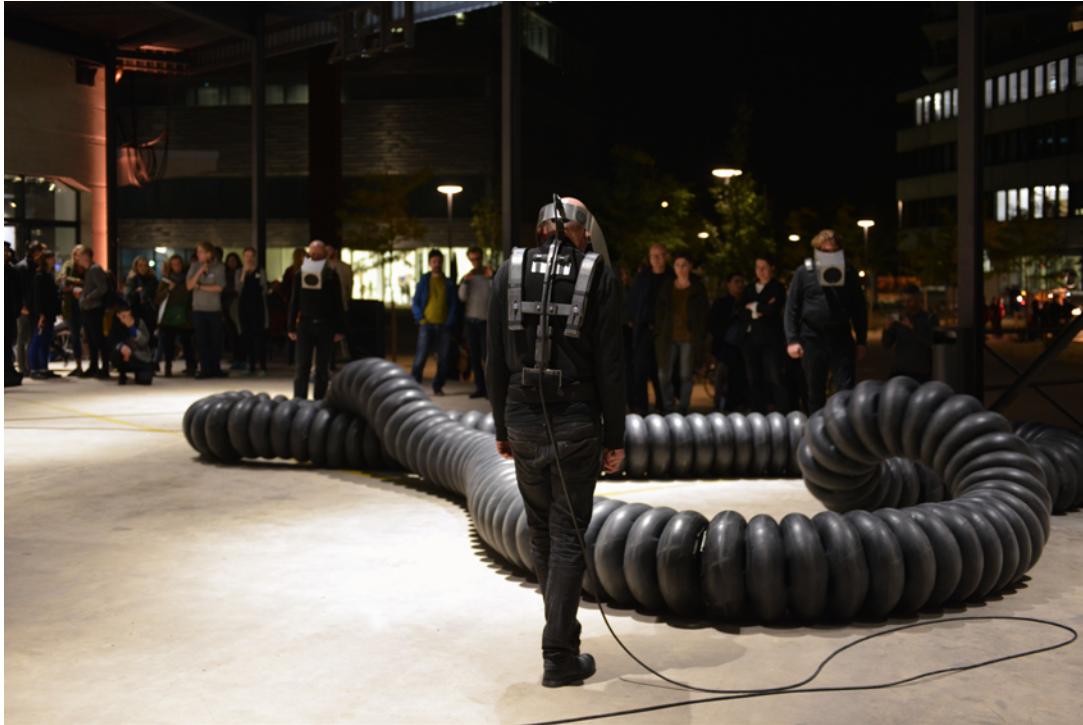
Iton - COD.ACT

Toujours attentif à la scène artistique Suisse, ELEKTRA proposera également en ouverture de cette soirée le duo COD.ACT (CH) avec sa nouvelle performance encore inédite en Amérique du Nord intitulée Iton , un intrigant dispositif interagissant avec quatre performeurs.